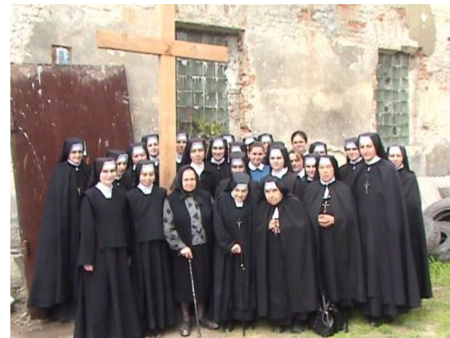
Сестри на Плуговій моляться за духовне пробудження Львова і цілої України.

Сестри своїм нападникам простили і надалі перебувають в с. Пробіжна, молячись за духовне воскресіння Церкви.